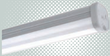
n s 支架系列