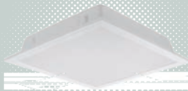
n s 燈盤系列