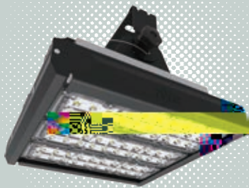
Tunn s 隧道燈系列