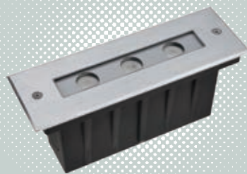
In- un s 埋地燈系列