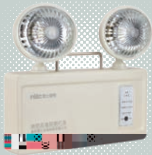
n s 2 消防應急系列二